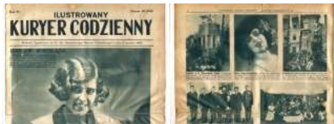
Kurier Codzienny z 10 grudnia 1928 r. - informacja o odsłonięciu pomnika.