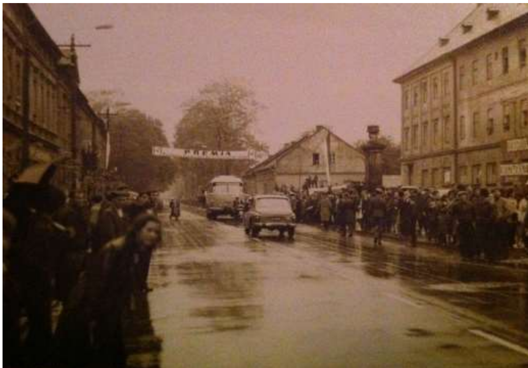
Etap wyścigu kolarskiego w Wadowicach; z lewej cokół pomnika, lata 70.