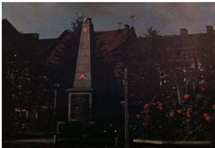
Pomnik Wdzięczności dla żołnierzy radzieckich, stojący na wadowickim rynku – Placu Armii Czerwonej od lat 40. do 1969 r.