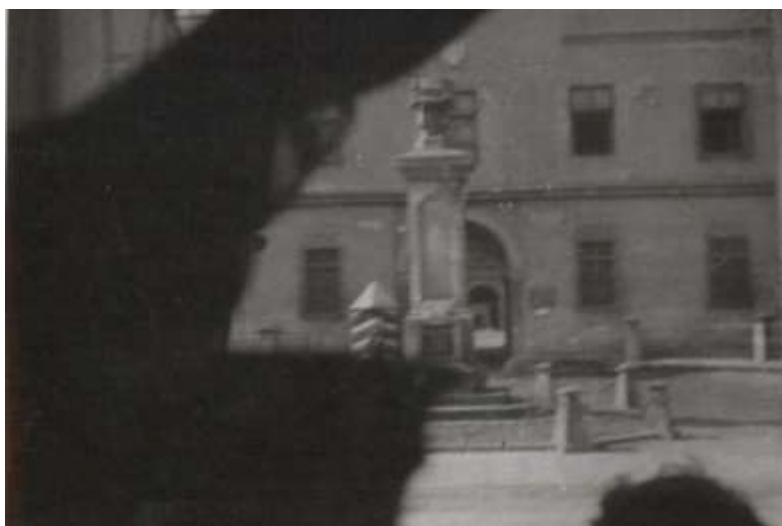
Oszpecony przez okupanta cokół pomnika. Z lewej strony widoczna niemiecka wartownia (charakterystyczne trójkolorowe, białe – czerwone – czarne malowanie); 1940/1941 (?)