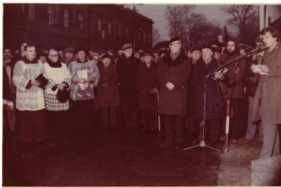
Odsłonięcie pomnika 15 listopada 1981 r. (zbiory wadowickiej Solidarności)