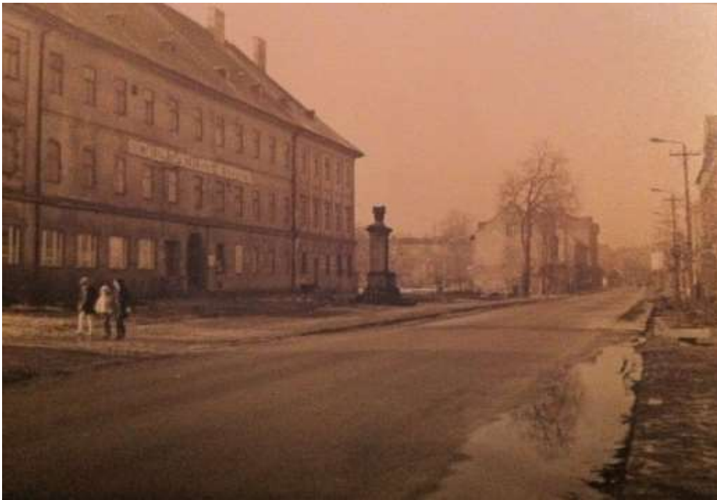
Cokół pomnika przed budynkiem Zakładów Zielarskich „Herbapol”; przełom lat 60. i 70.