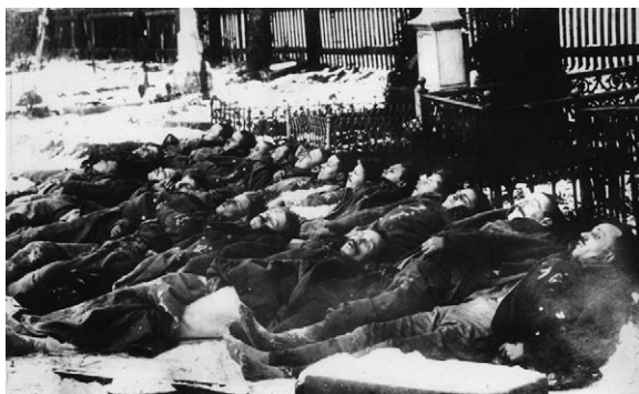
Żołnierze polegli i pomordowani w walkach o Stonawę (styczeń 1919 r.)

Płk Latinik około godziny 14:00 miał już informacje o rozbiciu oddziału kpt. Hallera. Ważna linia kolejowa, tzw. kolej północna, pozostała z Zebrzydowic do Dziedzic bez osłony 63 . Czesi mieli więc otwartą drogę na niebronione mosty kolejowe i drogowe w Drogomyślu. Istniało także realne zagro-