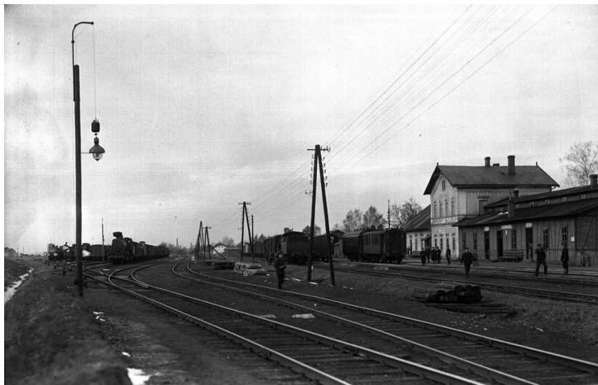
Budynek dworca kolejowego w Zebrzydowicach (1919 r.)