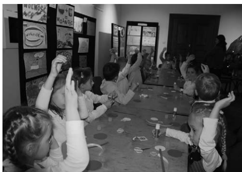
Warsztaty „Zapomniana listopadowa tradycja”.

Na tydzień przed głównymi obchodami święta 11 listopada w Muzeum Miejskim w Wadowicach odbyły się spotkania edukacyjno-warsztatowe dla młodzieży ze szkół podstawowych i średnich pt. „Zapomniana listopadowa tradycja”. Podczas warsztatów przybliżono uczniom obchody listopadowego święta, zwłaszcza zwyczaj uroczystego dekorowania okien