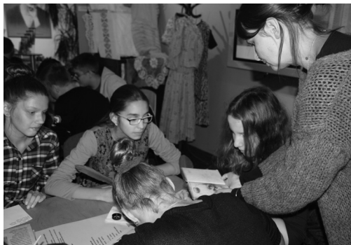
„Dawne sztambuchy – dzisiejsze blogi” – warsztaty towarzyszące wystawie „Niedzisiejsze bohaterki”.

ekspozycji „Niedzisiejsze bohaterki”. Zwiedzający mogli także wziąć udział w grze terenowej pt. „Wadowickie drogi do niepodległości”.