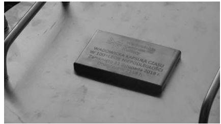
Wadowicka kapsuła czasu.

dokumentujące historię naszego miasta, mapy i foldery, przewodnik po Muzeum Domu Rodzinnym Jana Pawła II, seria okolicznościowych znaczków pocztowych. Nie zabrakło też przepisu na kremówkę od Cukierni Wadowice oraz pamiątek od mieszkańców: zdjęć, aktualnych lokalnych gazet, płyt CD i listów napisanych przez dzieci.