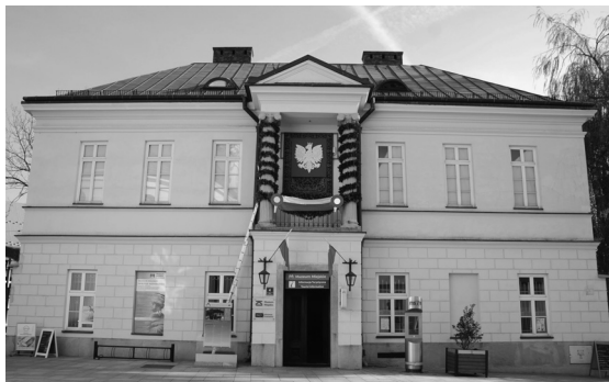
Dekoracja budynku Muzeum Miejskiego.

i balkonów, zapoznano ich z okolicznościami i przyczynami odzyskania niepodległości przez Polskę w 1918 r. Uczniowie wykonali także własne patriotyczne ozdoby.