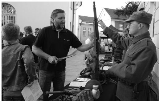
Niepodległościowa Noc Muzeów.

Już od wielu lat Muzeum Miejskie w Wadowicach koordynuje „Noc Muzeów” w powiecie wadowickim. W tym roku jej tematem przewodnim było odzyskanie niepodległości. W klimat wydarzeń sprzed stu lat wprowadzali m.in. rekonstruktorzy jednostek wojskowych,