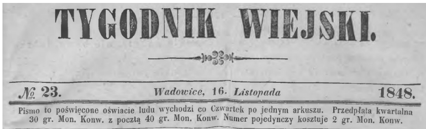
Winieta „Tygodnika Wiejskiego”, 1848 r. „Nadwiślanin Kalendarz z rycinami na rok 1852”.