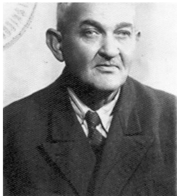
Legitymacja ubezpieczeniowa nr 1315883 (Archiwum muzeum miejskiego w Wadowicach).

W 1908 r. Bruno Zajac piastuje funkcję nauczyciela w szkole ludowej w Stryzowie 7 , w tym samym roku „Dziennik urzędowy c.k. Rady szkolnej krajowej w Galicyi” 8 podaje informację o utworzeniu w Tomicach jednoklasowej szkoły ludowej. To późne jej utworzenie można zapewne łączyć z faktem prężnego działania szkół w pobliskich Wadowicach.