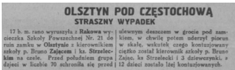
Wycinek z „Robotnika”.