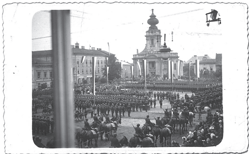
Wadowicki Rynek – Plac Józefa Piłsudskiego w dniu uroczystości przekazania 12 pp sprzętu ufundowanego przez Społeczeństwo Ziemi Wadowickiej w ramach Funduszu Obrony Narodowej 31.07.1938 r.

Stosowanie wyróżnika indywidualizującego tradycję pułkową było istotne odegrało znaczącą rolę w większości armii świata. To właśnie przywiązanie żołnierza do określonej tradycji, do korzeni jednostki, do sztandaru, jako widomego znaku (pamiętajmy o herbach Wadowic, Andrychowa i Kalwarii na