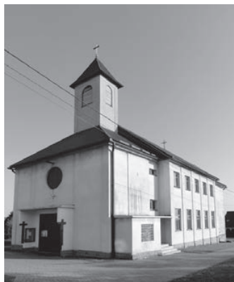
Kościół pw. św. Stanisława Biskupa i Męczennika w Stanisławiu Dolnym