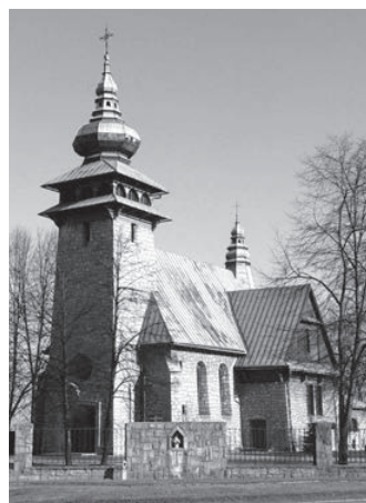
Kościół pw. Matki Bożej Królowej Polski w Ryczowie