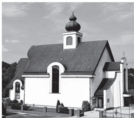
Kościół pw. Miłosierdzia Bożego w Barwałdzie Górnym