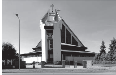
Kościół pw. św. Stanisława Biskupa i Męczennika w Andrychowie

W latach 70. rozpoczęto budowę nowego osiedla przy dzisiejszej ul. Włókniarzy dla pracowników andrychowskich zakładów pracy. Równocześnie ówczesny metropolita krakowski kard. Karol Wojtyła utworzył w Andrychowie nowy ośrodek