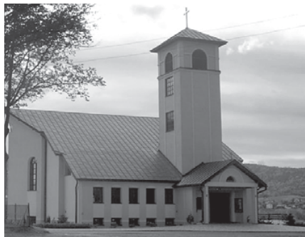
Kościół pw. Matki Bożej Pocieszenia

świętyni, wystawiono parkan wokół kościoła, a także ułożono chodniki z kostki brukowej. Wybudowano też plebanię i założono cmentarz oraz parking. We wnętrzu świątyni uwagę przyciągają ciekawie wykonane z ceramiki wizerunek Matki Bożej i stacje Drogi Krzyżowej 17 .