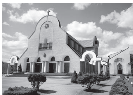
Kościół pw. św. Piotra Apostoła w Wadowicach