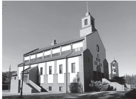
Kościół pw. Miłosierdzia Bożego w Spytkowicach-Łęgu