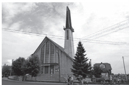
Kościół w pw. Matki Bożej Anielskiej w Łączanach