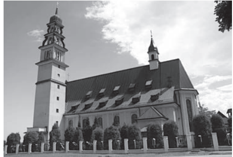
Kościół pw. Najświętszego Serca Pana Jezusa w Brzeźnicy