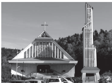
Kościół pw. św. Bartłomieja i św. Łukasza w Zagórniku