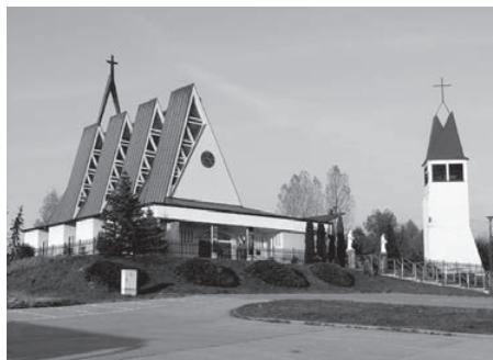
Kościół pw. św. Mikołaja w Witanowicach

wonego i białego marmuru karraryjskiego w kształcie rzutu poziomego bazyliki św. Piotra w Rzymie. Jego serce stanowi złożone, półkoliste tabernakulum w miejscu konfesji nad grobem św. Piotra. Sześciometrową ścianę ołtarza zwieńcza obraz będący kopią XVI-wiecznego fresku Perugina z kaplicy Sykstyńskiej. Przedstawia on przekazanie przez Chrystusa kluczy św. Piotrowi. Na posadzce zarysowano eliptyczną kolumnadę Berniniego na placu św. Piotra. Dwa pasma czerwonego marmuru „spływające” od ołtarza symbolizują stróżki krwi. Na posadzce umieszczono tabliczkę z datą 13.V.1981 r., która symbolizuje miejsce zamachu na Jana Pawła II 22 . Po lewej stronie ołtarza znajduje się figura MB Fatimskiej, którą ofiarował bp diecezji Leiria-Fátima. Poświęcił i ukoronował ją Ojciec Święty w 1991 r. Obok umieszczono tron papieski z tegoż roku oraz portret Ojca Świętego pędzla J. Hagnera (1992), dar prof. dr. hab. T.M. Janowskiego z Krakowa (1994). Przed kościołem znajduje się spiżowy pomnik Jana Pawła II wykonany przez włoskiego artystę Luciano Minguzziego 23 .