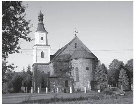
Kościół pw. Nawiedzenia Najświętszej Maryi Panny w Tłuczaniu

Obecny kościół parafialny powstał w wyniku tragedii, jaka dotknęła wieś w październiku 1943 r. Wtedy to w godzinach przedpołudniowych drewniana, modrzewiowa świątynia z połowy XVI w. stanęła w płomieniach. Kościół spłonął doszczętnie,