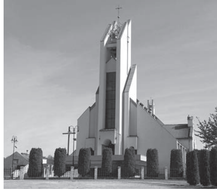
Kościół pw. Niepokalanego Serca Najświętszej Maryi Panny