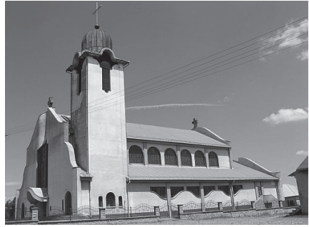
Kościół pw. św. Joachima i św. Anny w Tomicach