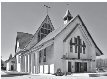
Kościół pw. św. Jana Chrzciciela w Sułkowicach-Bołęcinie