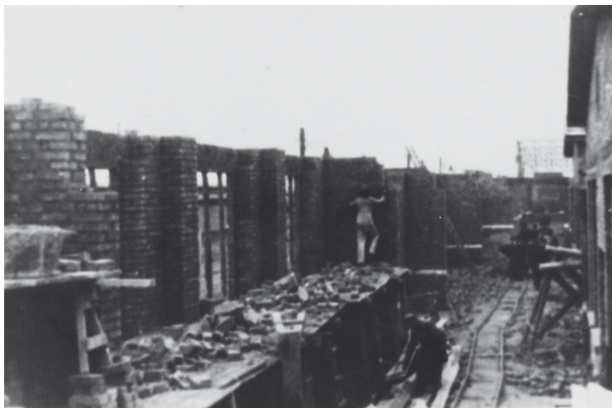
DAW – więźniowie przy pracy

Nie wszyscy więźniowie mieli jednak możliwość pracy w budynku.