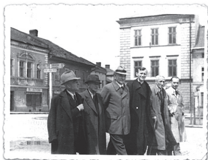
Uczestnicy zjazdu w 10-lecie matury na wadowickim rynku 16 lipiec 1948r.