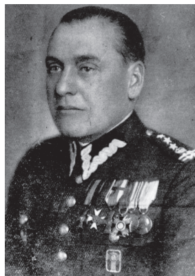
Płk dypl. Stanisław Maczek dowódca 10 brygady kawalerii zmotoryzowanej