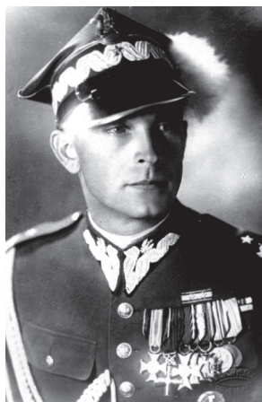
Gen. bryg. Mieczysław Boruta-Spiechowicz dowódca grupy operacyjnej „Bielsko” - „Boruta”