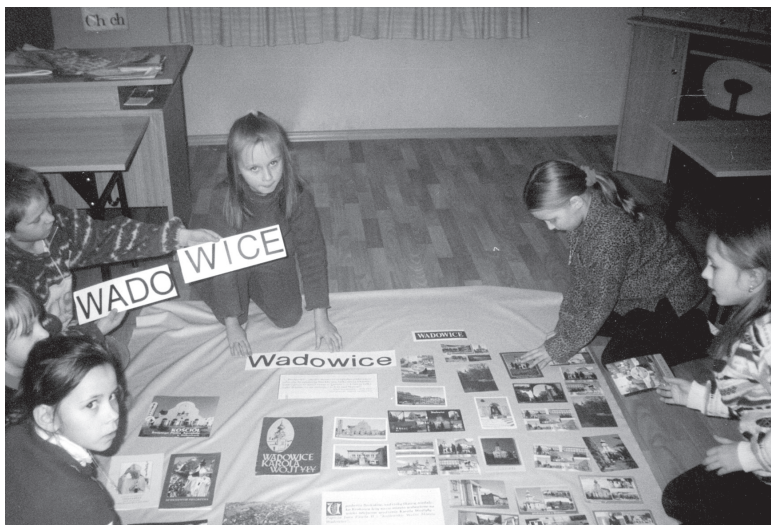
Dzieci ze Szkoły Podstawowej nr 3 przygotowują wystawę o Wadowicach.