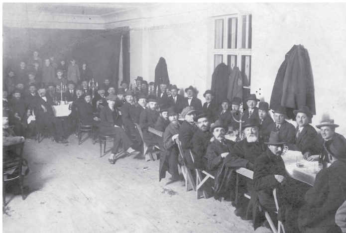
Członkowie andrychowskiej gminy żydowskiej uczestniczący w spotkaniu zorganizowanym w budynku kahalnym. Arch. Prywatnego Muzeum w Andrychowie

„Kolumnę dziewcząt żydowskich wysłali Niemcy na wieś aby tam porządkowały domy na przyjęcie niemieckich osiedleńców. Dziewczęta te nawet przy pracy nie traciły humoru, przyśpiewywały sobie, z wartowników Niemców delikatnie sobie drwiły, a przed portretami fuhrera stawiały flakony z kwiatami bo czego innego nie mogły uczynić zbrodniarzowi” (30.12.1964 - data zapisu).