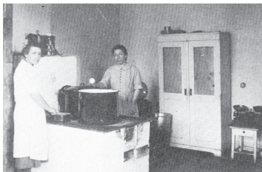
Wspólna kuchnia w andrychowskim getcie. Arch. Instytut Żydowski Yad Vashem Israel

Krzyża przy okazji podobnych wizyt w Auschwitz. Getto było właściwie otwarte pilnowane przez samych Żydów. Przekonani byli, że wewnętrzna dyscyplina, solidna praca dadzą im poczucie przetrwania. Zasada ocalenia przez pracę tu się Niemcom sprawdzała. Stąd pomimo otwartego getta ucieczek właściwie nie było. Niemcy