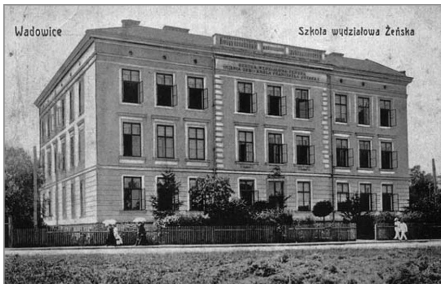
Fot. 2. Gmach Żeńskiej Szkoły Wydziałowej przy ulicy Długiej w Wadowicach.

wana w dniu 7 września 1907 r., czyli – jak wówczas sądzono – jeszcze w trakcie trwania wystawy. Faktycznie loteria ta odbyła się dopiero 7 października 1907 r. 46