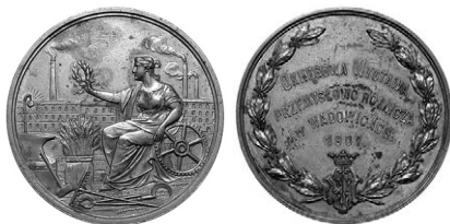
Fot. 5. Medal Okręgowej Wystawy Przemysłowo-Rolniczej w Wadowicach, 1907 r.