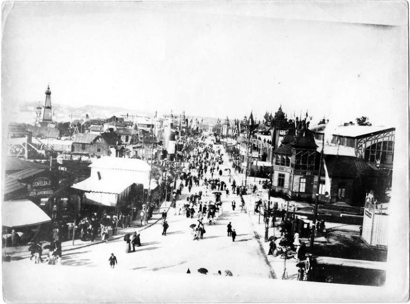
Fot. 1. Powszechna Wystawa Krajowa we Lwowie w 1894 r. (fotografia ze zbiorów własnych autora).

lokalne wystawy zorganizowano m.in. w Tarnowie w 1904 r. oraz w Przemyślu, dwa lata później 21 .