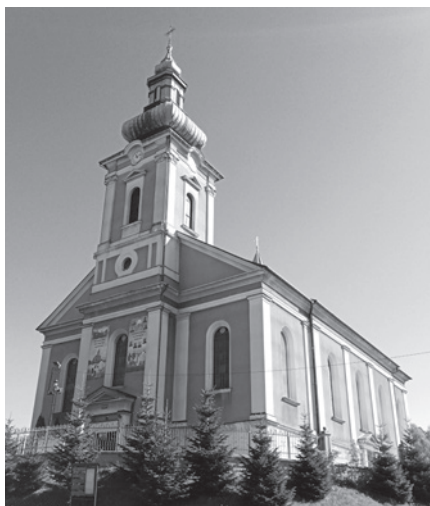
Kościół parafialny w Wieprzu wybudowany w ostatnim ćwierćwieczu XIX w.