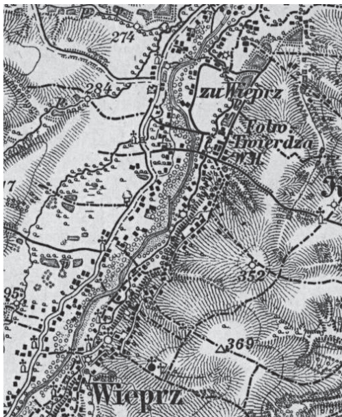
Fragment mapy Wieprza z 1911 r. Spezialkarte der österreichisch-ungarischen Monarchie.

Dokonaną przez historyka konkluzję można odnieść także do innych galicyjskich wsi, w tym do Wieprza leżącego nieopodal Andrychowa. Wieprz był jedną z największych i najbogatszych wsi w zachodniej części ówczesnego powiatu wadowickiego. Od XVIII w. ówcześni właściciele Schwarzenbergowie – Czerni, a później Ankwiczowie zaczęli wprowadzać w gospodarstwach chłopskich formę użytkowania ziemi, jaką było zakupieństwo. Chłopi musieli nabywać prawa do gruntu za odpowiednią sumę pieniędzy, przez co byli bardziej przywiązani do gospodarstw. Jednak mimo to, nabywając prawa dziedziczne, mogli swoje zagrody sprzedawać czy